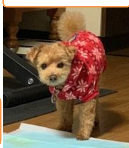
トイレ失敗のとき