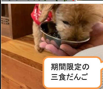
期間限定の三食だんご