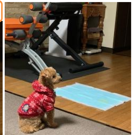
お母さんを待っているとき