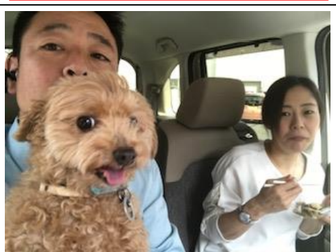
三人でお出かけ♪ご機嫌さん