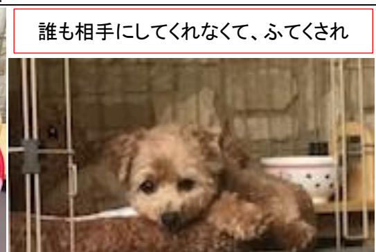
誰も相手にしてくれなくて、ふてくされ