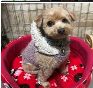
冬の洋服☆ご機嫌です