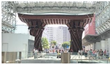
金沢駅の鼓門です、日本で最も美しい駅だそうです