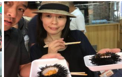
地ウニを二人で食べて♪