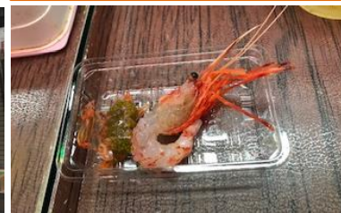
活 オニえびを二人で食べて♪