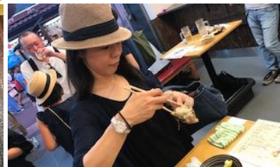
岩ガキの生ガキ・焼きガキの食べ比べをして(^_^)