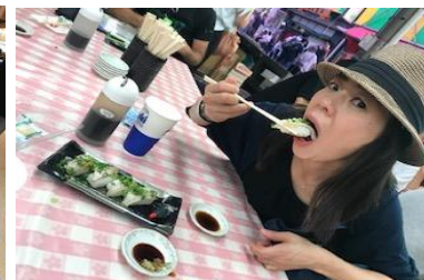
のどぐろ 寿司をで食べて♪