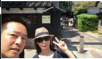
忍者寺です、中は☑ためでした