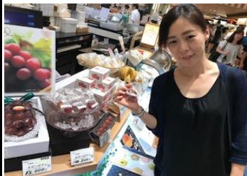
1粒 千円 ブドウ 食べて♪