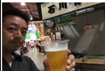
二人で飲みまくりました♪