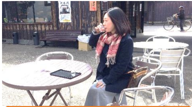
↑黄桜酒造に着くなり酒飲み比べセットを飲んでました