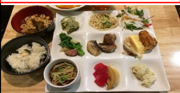
↑おばんざい食べ放題も行きました