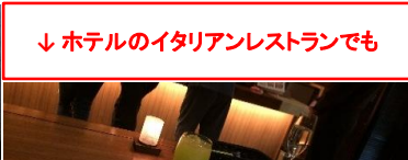
↓ホテルのイタリアンレストランでも