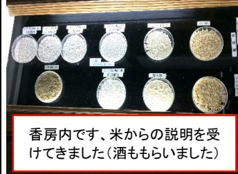
香房内です、米からの説明を受けてきました(酒ももらいました)