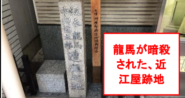
龍馬が暗殺された、近江屋跡地