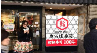
龍馬が襲われた場所