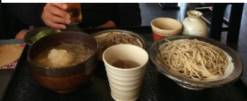
↑有名な京そばも食し