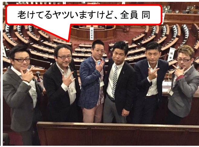
老けてるヤツいますけど、全員 同