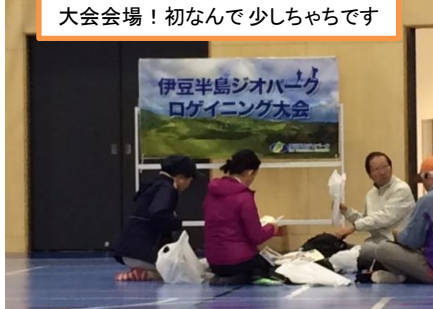
大会会場！初なんて少しちゃちです

こちらの先輩と出場しました。この先輩、実は伊豆半島唯一のお方で、その内容は、フルマラソン以上の距離のレース各都道府県完走全県制覇という伊豆一人達成していない凄いキャリアの持ち主！こんな方と一緒に緊張もありましたが、楽しく参加できました