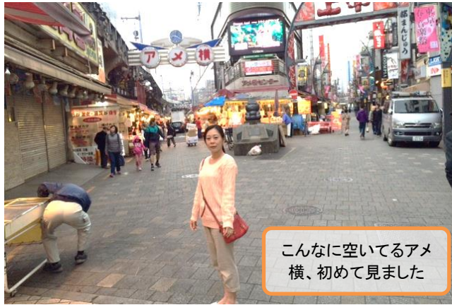
こんなに空いてるアメ横、初めて見ました