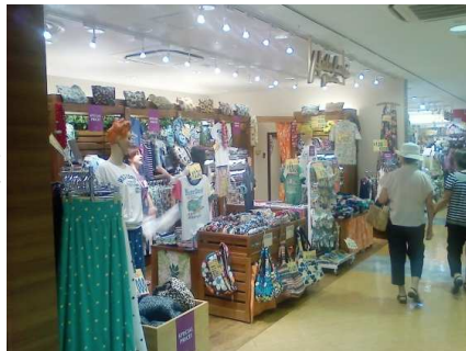
★路地行き止りに隠れた名店発見★