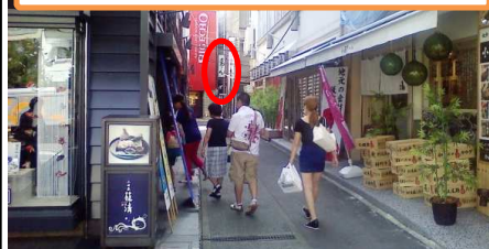
行き止りの先に地下が！