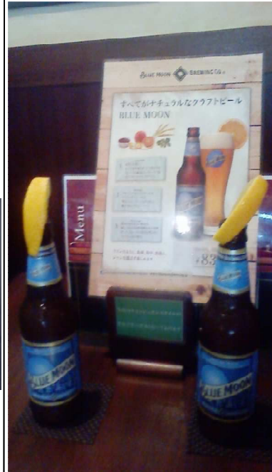
こんなビールあるの知ってますか？BLUE MOON 名前がオシャレで、バーではこのビールを飲みました