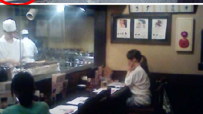
古民家な焼き鳥屋がありました♪ ここでもたらふくビール飲みました