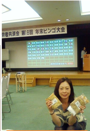
大分県「とりあん」の唐揚げ

今年も共済会の年末ビンゴ大会に行ってきました。もちろんの「とく景品はいただいていたんですけど、私・妻とも ドベのほうでしたが、← こんなのいただきました。