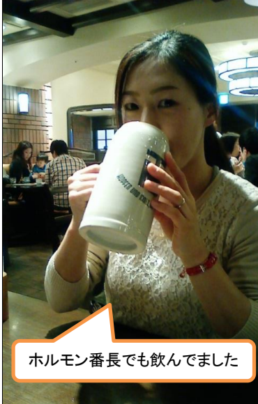
ホルモン番長でも飲んでました

最近の東京駅は面白いですね、→こんな感じで「カールビー」や「森永」、ズリコなどの菓子屋さんのファーストフード店があったり、また「ラジテレビ」「TV東京」「TBS」「NHK」などのTVショップが並んだり、駅の中だけで遊べました。でも駅中で一番妻が喜んだのがこれでした←