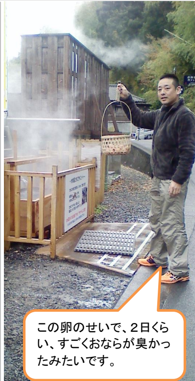
この卵のせいで、2日くらい、すごくおならが臭かったみたいです。

妻の誕生日を理由に、ただ単に私が「アメ横」に行きたかっただけかもしれないですが、お買いものに行ってきました。今回は年末ということ、食材沢山と超ニセモノの腕時計を家族全員で買ってきました。(私が高級そうな時計をつけていたら、千円の時計です)そして上野に行ったからこれ↓ということ、いつも行ってる焼肉屋「ホルモン番長」に行ってきました。でもここに行くとは何故か、必ずその日の夜はお腹