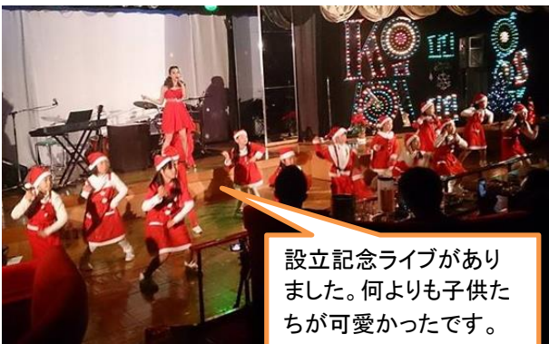
設立記念ライブがありました。何よりも子供たちが可愛かったです。

グッディーズとは・・・東伊豆を中心に地域活性化のために、まちづくりの推進等経済の活性化を図る活動、学術、文化、芸術又は、スポーツの振興を通じた青少年の健全な育成、音楽文化の向上等に関する活動を行い、人及び団体の交流による活力ある地域社会の実現に寄与することを目的とする団体 ↑だそうです、で、この団体の設立パーティーに呼ばれて行ってきたのですが、夜の7時開演で初めから、ウイスキー水割りで、あまり食べ物もなく、よく酔ってしまいました。