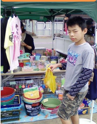
↓おもちゃ手榴弾買ってました

第二回目のUSAMIフェスに行ってきました。朝一番で行ってきましたが、朝から凄い人数で、店舗数もかなり多くとても楽しいイベントでした、夜にはベリーダンスなども出て賑わったようですが、私たちは食べ物ばかりに目が行ってしまいました。ちなみに私たちが食べたものは「ちんちん揚げ」「練乳いちご」「イパテイーニ」「マヒマヒバーガー」「イパ尾サンド」「タロワツサン」と食べましたが食べすぎですよね！あと愛犬チョコにもハワイアン柄のネックレスを買ってあげました (右の写真の青いヤツ)