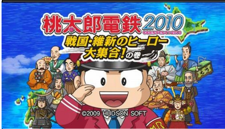
桃太郎電鉄シリーズ(ももたろうでんてつシリーズ)とは鉄道会社の運営をモチーフにしたボードゲーム形式のコンピュータゲーム・テレビゲームシリーズである。ハドソンの

カイトの居る日曜日は、昼間から、二食分の料理を作りテーブルにバイキングスタイルでセットし「桃太郎電鉄(TVスゴロクゲーム)」を長時間やりながらまったりとしています。これがここ1か月くらいの私たちのブームになっております。