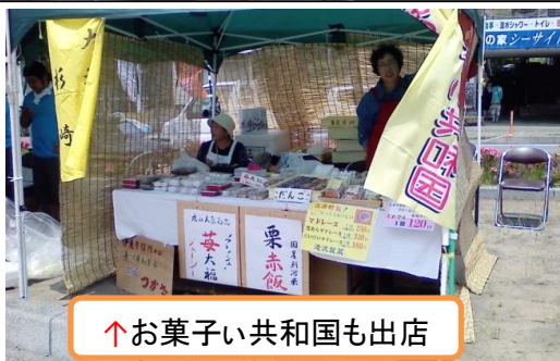
↑お菓子い共和国も出店

・10月27日 大井川マラソン (42.195kmマラソン) 目標: 3時間40分