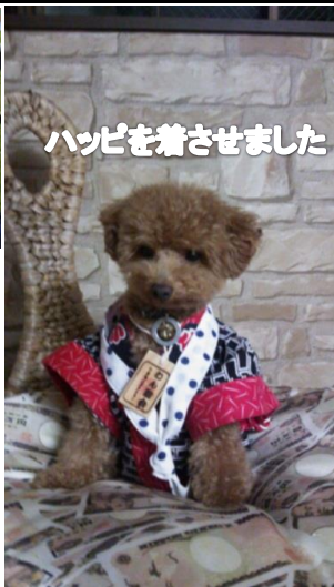
ハッピーを着せました