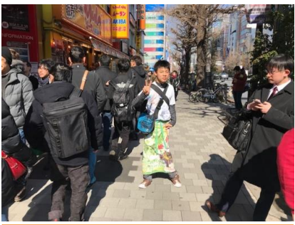
↑次は、秋葉原でアニメオタクファッションで街を練り歩き

↓次の日もカイトは凄かった！こやつ、ホテルで朝食一口も食べないのに、朝一築地で高級品食べあさり