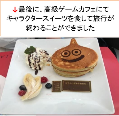
↓最後に、高級ゲームカフェにてキャラクタースイーツを食して旅行が終わることができました

凄い疲れた旅行でしたが、自宅でゲームキャラクターのお土産で遊んでるちよこの姿に癒されました。