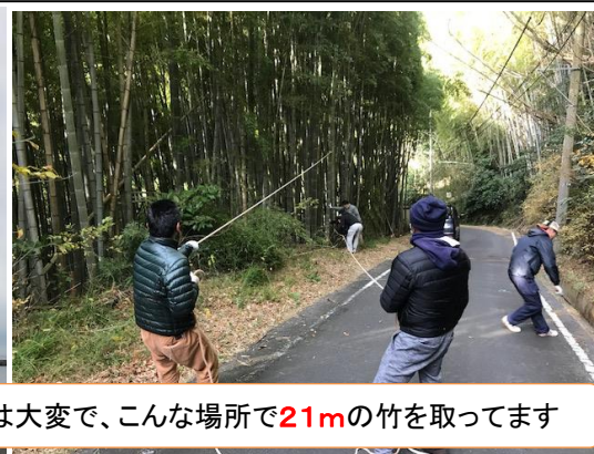
楽屋裏は大変で、こんな場所で21mの竹を取ってます