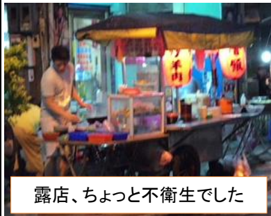
露店、ちょっと不衛生でした