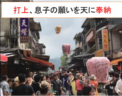
打上、息子の願いを天に奉納

台北ロータリーの式典で初めて妻と社交ダンスを踊りました(^_-)☆ぎこちなさが、、、