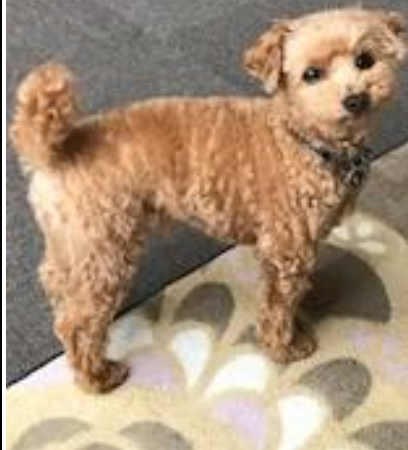
この写真位置、得意です♥