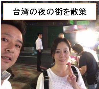
台湾の夜の街を散策