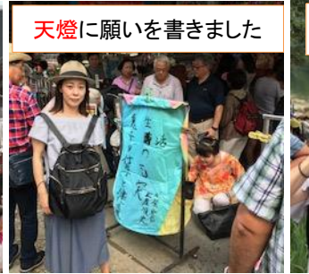
天燈に願いを書きました