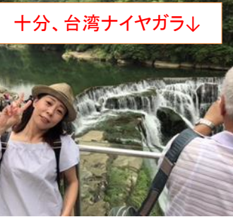
十分、台湾ナイヤガラ↓