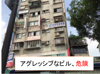
アグレッシブなビル、危険