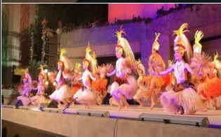
テンポの速い タヒチアンダンス