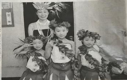
アロハの精神を重視

↓またまた 妻のことをよく書いてくれてとてもありがたいです。伊豆新聞の取り上げ方が凄い♪でも子供のフラは可愛いですね