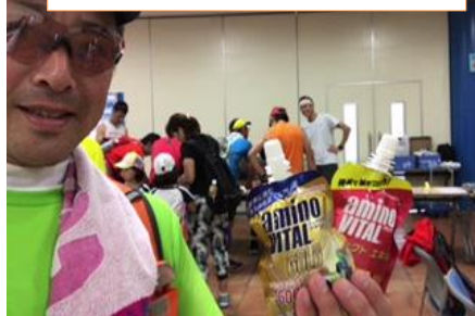
順位は 23/30位 でも賞品もらっ