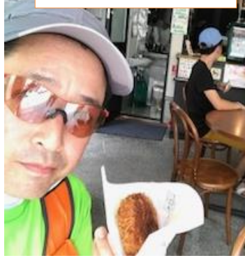
三島コロッケ美味しい♥