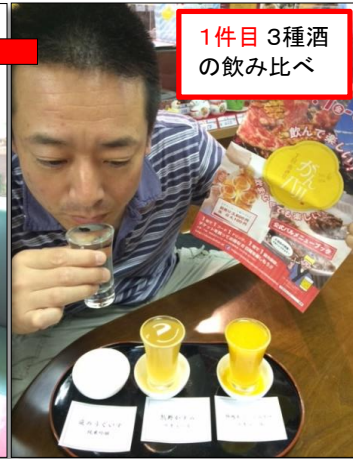
1件目 3種酒 の飲み比べ