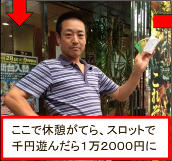
ここで休憩がてら、スロットで千円遊んだら1万2000円に