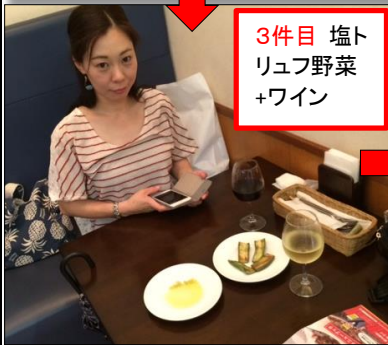
3件目 塩ト リュフ野菜 +ワイン