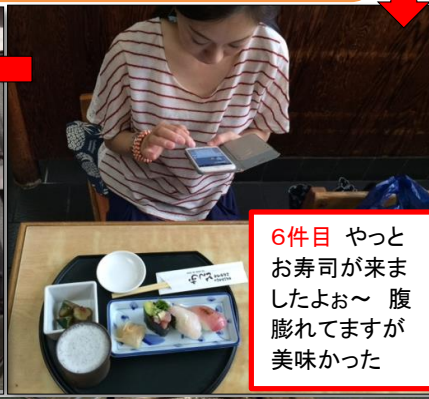
6件目 やっとお寿司が来ましたよ～ 腹膨れてますが美味かった