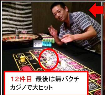
12件目 最後は無バクチカジノで大ヒット