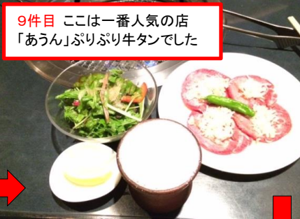
9件目 ここが一番人気の店「あうん」ぶりぶり牛タンでした