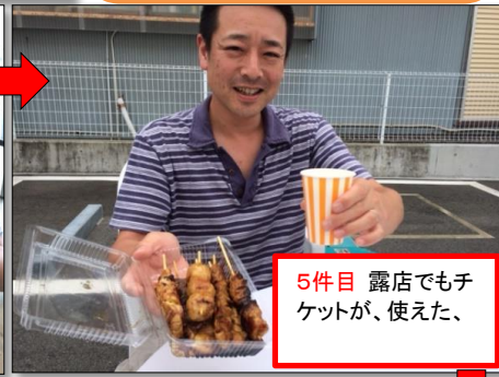
5件目 露店でもチ ケットが、使えた、