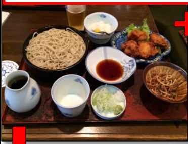
7件目 この店が、今回私の中での1位の店「そばや藪(やぶ)」美味しいのなんのって、お腹に子供がいるかのように膨れました

・8月20日 東伊豆細野高原 アドベンチャーレース (15kmくらい) 商工会議所の仲間と 走ってきます!(^^)!