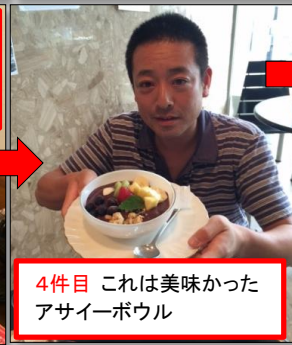
4件目 これは美味かった アサイーボウル