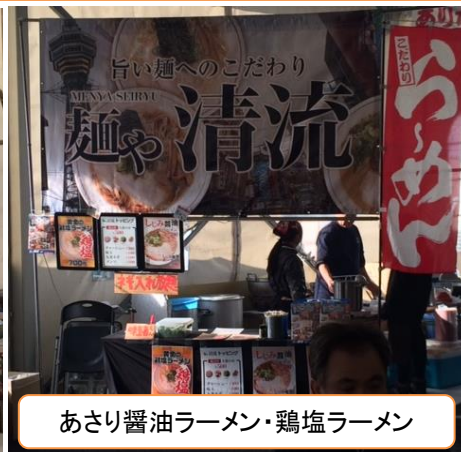
あさり醤油ラーメン・鶏塩ラーメン