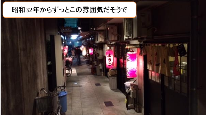
昭和32年からずっとこの雰囲気だそうで