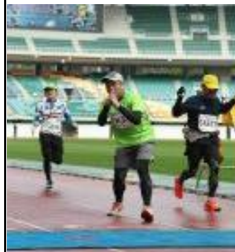
最後は五郎丸でゴールしました

クラウンメロンマラソン (42.195km)に出場してきました(^◇^)ここは県内No1のアップダウンフルマラソンで、給食で大量のフルーツが食べれる大会です、今年はバナナ=大量、オレンジ6~7キレ、イチゴ=8つぶに食べてきました、そしてここはスタート&ゴールがエコパの競技場の中なので、マラソン選手になった気分を味わえます