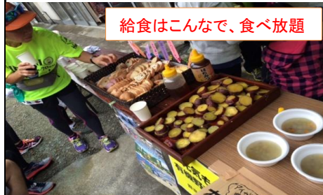
給食はこんなで、食べ放題