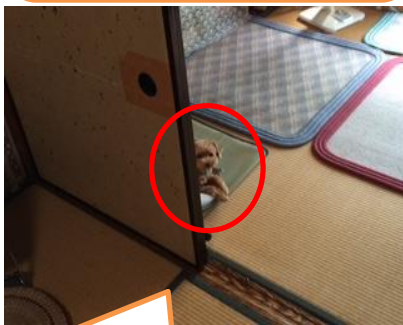
ちょこさん♪ 一応 隠れてます