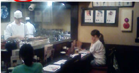
古民家な焼き鳥屋がありました♪ここでもたらふくビール飲みました