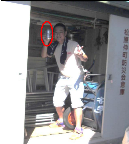
松原仲町防災倉庫

今年の防災訓練は、炊き出しがない代わりに右図のように、子供たちが放水訓練などをし、普段の消防団の方々の消火活動の大変さなどを実践勉強していました。そして私は、防災倉庫にて器具点検をしホット一息←