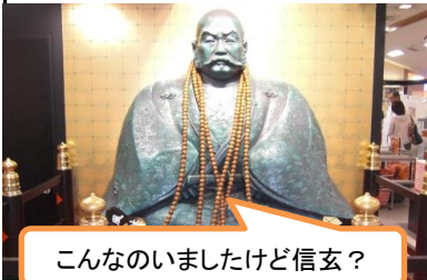
こんないましたけど信玄?